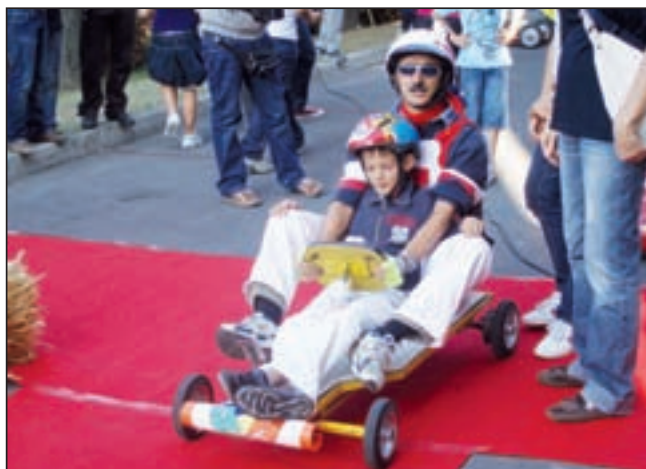
Una delle caratteristiche caratelle in gara

Nei senior i loro piloti si sono collocati ai primi 2 posti, seguiti al terzo da Godo solo di traverso.