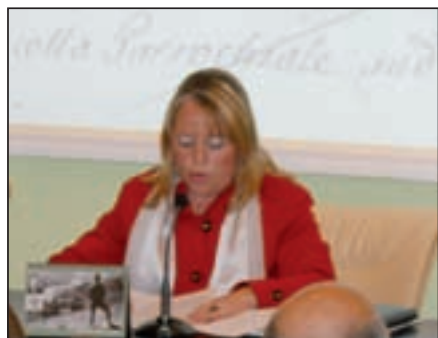
Il saluto di fine anno del Sindaco

Il risultato elettorale del 6-7 giugno ha premiato il buon lavoro della coalizione di centro-sinistra, la sua capacità progettuale e gestionale. Siamo un gruppo consiliare ben affiatato con grande spirito di servizio verso i cittadini. L'opposizione naturalmente in questi mesi ha