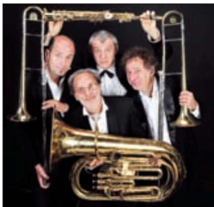
La Banda Osiris