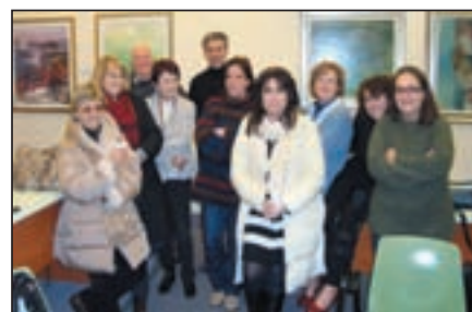
I partecipanti all'incontro del gruppo lettura del 15 dicembre

La partecipazione al Gruppo di Lettura è sempre aperta. Chiunque può decidere, in qualsiasi momento, di entrare a far parte del Gruppo di Lettura (o di uscire). Chi vuole ricevere le e-mail di informazione è sufficiente che lasci il proprio indirizzo di posta elettronica al banco della Biblioteca o invii una e-mail di richiesta a biblioteca@comune.coriano.mn.it .