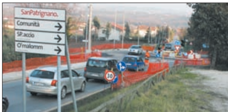
I lavori ormai ultimati della rotatoria all'ingresso della Comunità di San Patrignano

L'opera realizzata dalla ditta CLAFIC di San Piero in Bagno, dell'importo di 200.000 euro, è stata interamente pagata dall'omonima comunità in quanto obbligo di urbanizzazione previsto nel piano particolareggiato di iniziativa privata, recentemente approvato dal Consiglio Comunale.