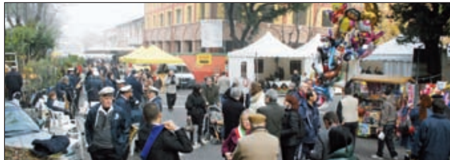
Via Garibaldi durante la Fiera dell'Oliva il 15 e il 22 novembre

Da qualche anno, Amministrazione Comunale e Pro Loco, cercano inoltre di arricchire gli appuntamenti infrasettimanali, in larga parte dedicati alla valorizzazione di prodotti enogastronomici del nostro territorio, attraverso la collaborazione delle associazioni di settore e di operatori privati. Inoltre, quest'anno, sfruttando la recente riapertura del nostro Teatro, CORTE, si sono voluti programmare alcuni spettacoli importanti, nel corso della settimana della Fiera. Il tutto per creare un effetto prolungato di attrazione delle persone verso il nostro Centro storico.