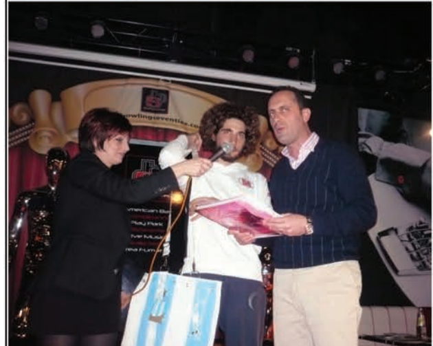
2011. Festa al Bowling di Cerasolo Ausa di fine campionato. Gli consegna un premio l'Assessore provinciale al Turismo Fabio Galli.