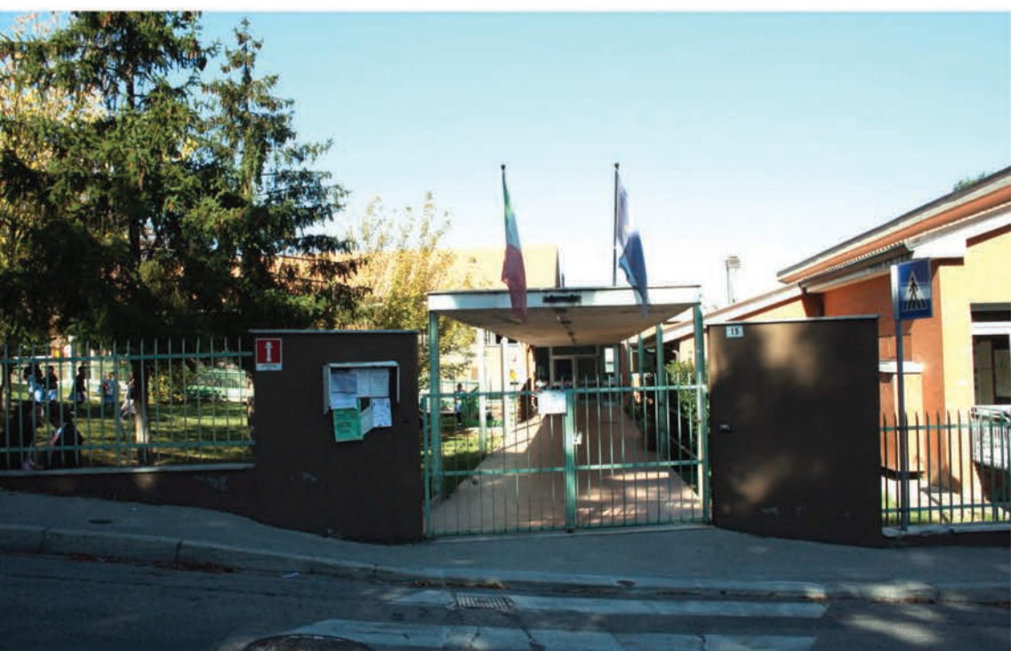
La Scuola Elementare "A. Favini" di Coriano